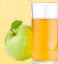
APFELSCHORLE cl. 33 € 3,00