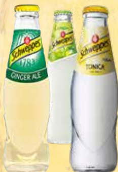
SCHWEPES TONIC - LEMON - GINGER ALE cl. 20 € 3,50