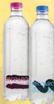
ACQUA minerale naturale o frizzante cl. 50 € 2,50