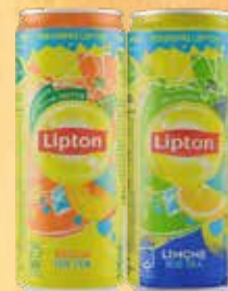
THE limone o pesca cl. 33 € 3,50