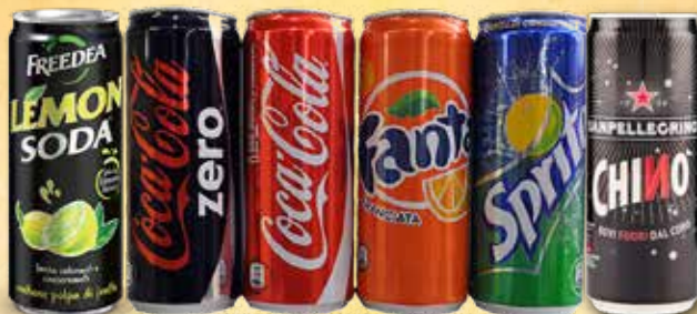
COCA COLA ZERO - COCA COLA - FANTA SPRITE - LEMON SODA - CHINOTTO cl. 33 - € 3,50